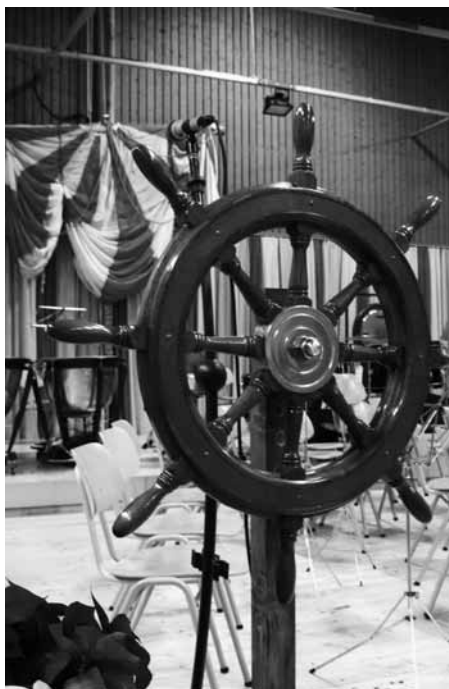
Stilechte Dekoration.

Unser Konzert, das ganz unter dem Motto «Norden» stand, kam qualitativ hoch stehend daher und dementsprechend positiv waren auch die Rückmeldungen aus dem Publikum.