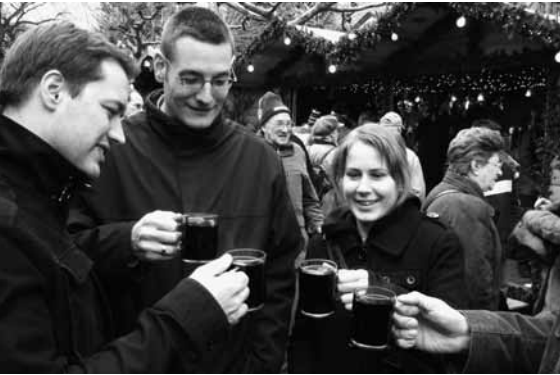
Glühwein, das Hauptgetränk am Weihnachtsmarkt in Deidesheim.

wird, und natürlich auch auf unser Jahreskonzert im November unter dem Motto «Bella Italia». Ich möchte die Gelegenheit nutzen, allen Musikantinnen und Musikanten,