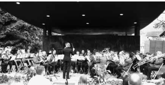
Die Feldmusik Beckenried auf Buochser Boden.

Das Vereinsjahr 2007 stand aus musikalischer Sicht ganz im Zeichen der Jugend. So war es erfreulich zu sehen, wie viele Jungmusikanten sich dazu entschlossen als «Schnupperstifte» am Sommerkonzert des Musikverein mitzuwirken. Anfangs Juni war es dann soweit, die Jungen traten zu ihrer ersten Probe mit dem Musikverein an und hinterliessen gleich einen fantastischen Eindruck. Der Klangkörper der Musik war plötzlich fast doppelt so gross. Das Sommerkonzert im Dorfpark war dann auch ein grosser Erfolg, sowohl bei den zahlreich erschienenen Zuhörern als auch bei den Musikanten, ob jung oder alt. Das Programm war zwar eher auf die Jungen ausgerichtet, hatte aber auch für die ältere Garde etwas zu bieten. Positiv war auch der Auftritt der Feldmusik Beckenried welche mit einem gepflegten Klang das Publikum verwöhnte.