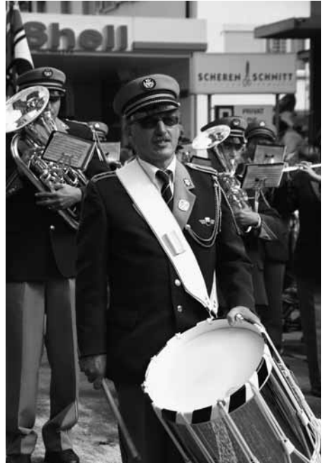
Bereit für den langen Umzug am Eidg. Ländlermusikfest in Stans.

Ende Sommer hatte der Musikverein einen Grossauftritt am Umzug des Eidgenössischen Ländlermusikfestes in Stans.